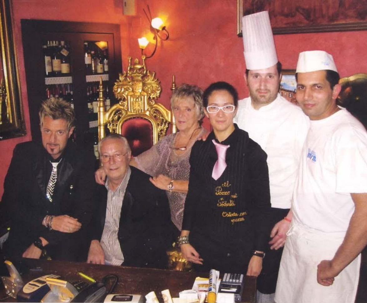
FOTO DI GRUPPO AL RISTORANTE IL POZZO DEL PODESTÀ DI ALBAVILLA (CO), LA CUI SPECIALITÀ È LA FIORENTINA DI CARNE CHIANINA ACCOMPAGNATA DA UNA RICCA SELEZIONE DI SALI DAL MONDO. SOTTO, L'ELEGANTE MODO IN CUI VIENE SERVITA.

di chef ne fanno largo uso, non solo per dare sapore ai piatti, ma anche per guarnirli. Lo sanno bene i proprietari e gestori del ristorante Il Pozzo del Podestà di Albavilla (Co), la cui specialità della casa è la vera fiorentina di carne Chianina accompagnata da una ricca selezione di sali dal mondo. L'idea di servire questa prelibatezza nostrana con sali particolari è nata da pochi anni in seguito a un suggerimento di alcuni clienti stranieri, che proposero di servire la carne con qualcosa che ne esaltasse il gusto. L'idea piacque all'istante e da allora iniziò uno scrupoloso lavoro di collezione di sali dal mondo.