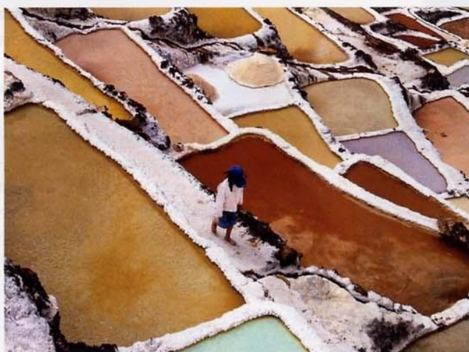
SUGGESTIVE IMMAGINI DELLE SALINE, IN ALTO QUELLE DI TRAPANI CON IL RELATIVO SALE, IN BASSO, LA SACRED VALLEY IN PERÙ.